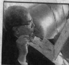
ದುಬೈನಿಂದ ಹೊರಡುವ ಮುನ್ನ ಐಪ್ಯೂಡ್‌ನಲ್ಲಿ ಪೇಪರ್ ಓದುತ್ತಿರುವ ಸಿಎಂ.